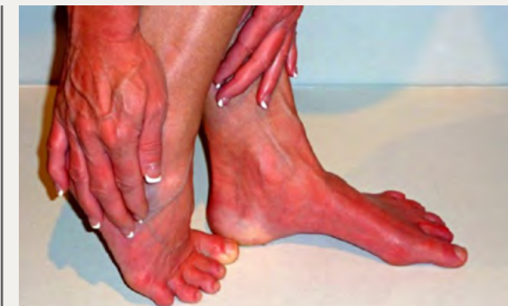
Erytromelalgi kan orsaka rodnad och svår smärta, särskilt på fötter och händer

Utvecklingsprogrammet har till syfte att etablera en teknologiplattform kring TRPV1 och utveckla behandlingar för andra indikationer än diabetes, till exempel erytromelalgi, och därmed öka värdet av bolaget för Pila Pharmas aktieägare.